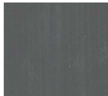
Gris éléphant (GR A)