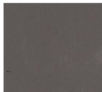
Expresso (GR M)