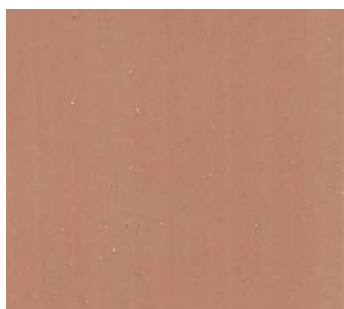
Tiramisu (BW 28)