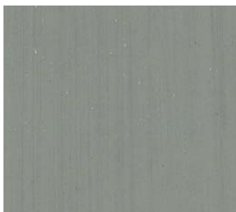
Crépuscule (GR A2)