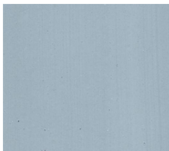
Gris moire (GR D1)