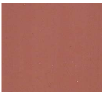
Caramello (BW D)