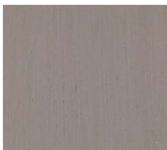
Café serré (POU 2)