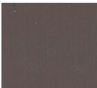
Brun cabane (BW E)