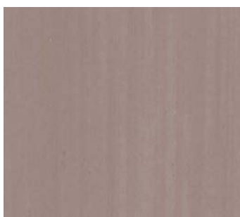
Brun toutou (POU 1)