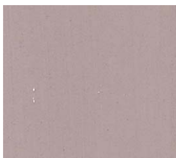
Amaretto (POU 5)