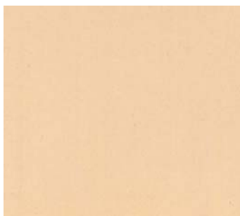
Mont jaune (JA 16)