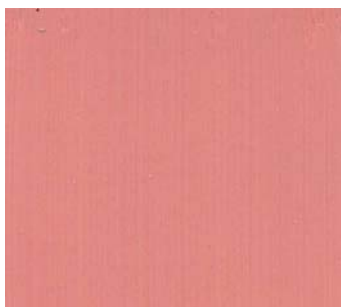
Orange corail (ORG H)