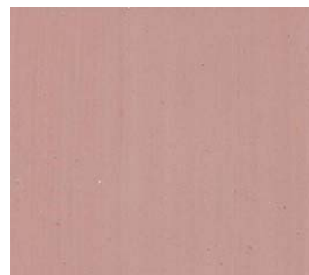
Terre à terre (ORG 71)