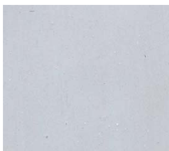
Flocon (POU 20)