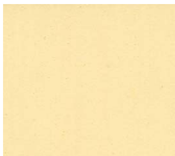
Jaune agrume (JA 11)