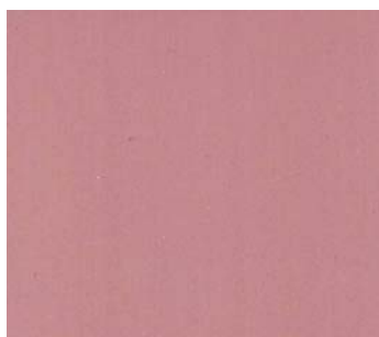
Toulouse rose (RG 41)