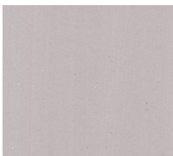
Marron glacé (POU 51)