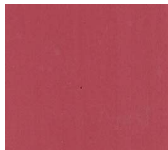
Rouge antique (RG 07)